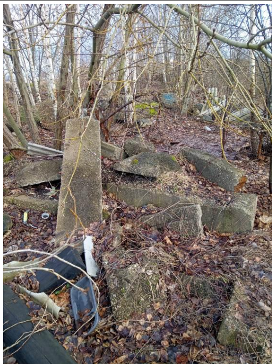
7.attēls. Objektā tiek uzglabāti jaukti, dažāda veida (plastmasas, betona, keramikas flīzes, stikla gabali, šiferis) būvniecības un būvju nojaukšanas atkritumi kaudzēs.