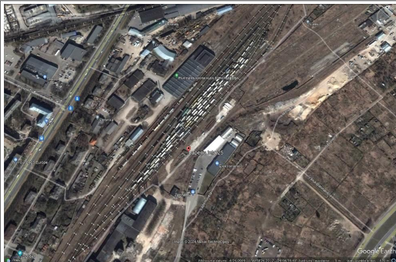
2.attēls. Saskaņā ar lietotnes Google Earth datiem 2009.gada aprīlī nekustamā īpašumā tiek veikta saimnieciskā darbība.