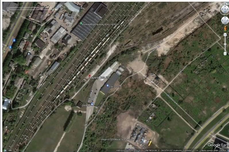
3.attēls. Nekustamā īpašuma fiksācija 2012.gada maijā. Lietotnes Google Earth dati (ekrānšāviņš).