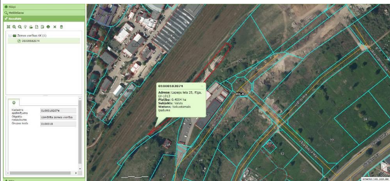
1.attēls. Nekustamā īpašuma ar kadastra Nr. 01000182074 atrašanās vieta.

01.02.2024. fotofiksācija Lapeņu ielā 25, Rīgā, lietotnes Google Earth dati un Valsts zemes dienesta kadastra informācijas sistēmas dati